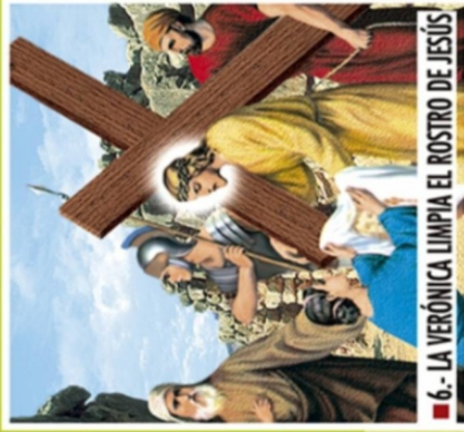
■ 6.- LA VERÓNICA LIMPIA EL ROSTRO DE JESÚS