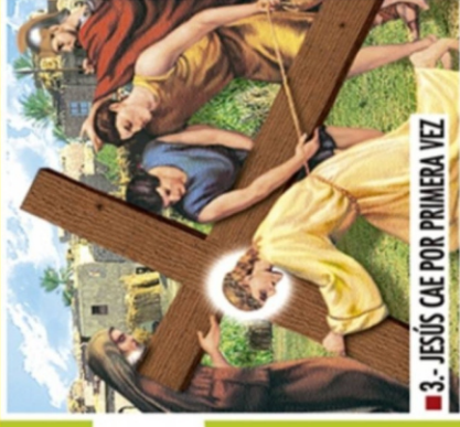
■ 3.- JESÚS CAE POR PRIMERA VEZ