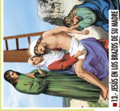
■ 13.- JESÚS EN LOS BRAZOS DE SU MADRE