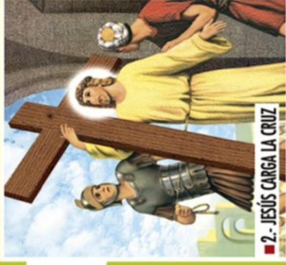
■ 2.- JESÚS CARGA LA CRUZ