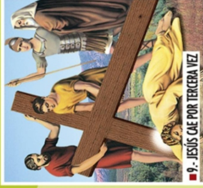
■ 9.- JESÚS CAE POR TERCERA VEZ