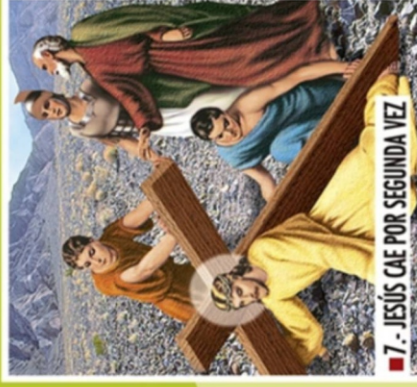
■ 7.- JESÚS CAE POR SEGUNDA VEZ