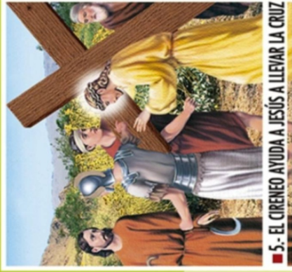
■ 5.- EL CIRENEO AYUDA A JESÚS A LLEVAR LA CRUZ