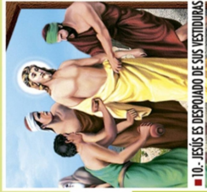
■ 10.- JESÚS ES DESPOJADO DE SUS VESTIDURAS