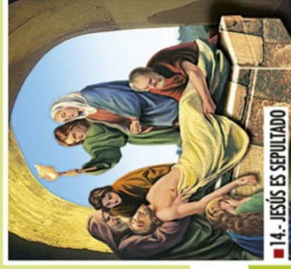
■ 14.- JESÚS ES SEPULTADO