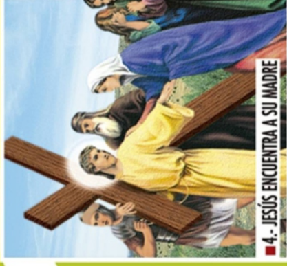
■ 4.- JESÚS ENCUENTRA A SU MADRE