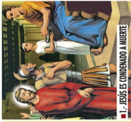
■ 1.- JESÚS ES CONDENADO A MUERTE