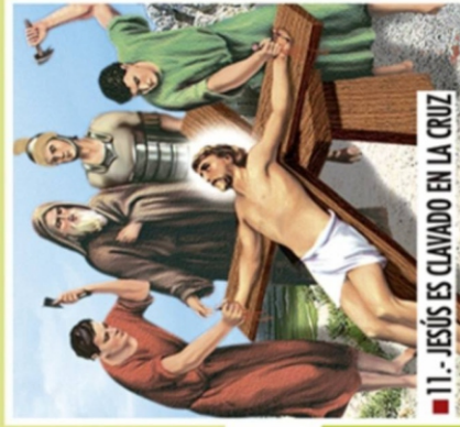
■ 11.- JESÚS ES CLAVADO EN LA CRUZ