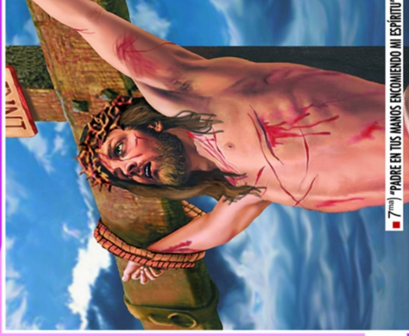
■ 7 ma ) "PADRE EN TUS MANOS ENCOMIENDO MI ESPIRITU"