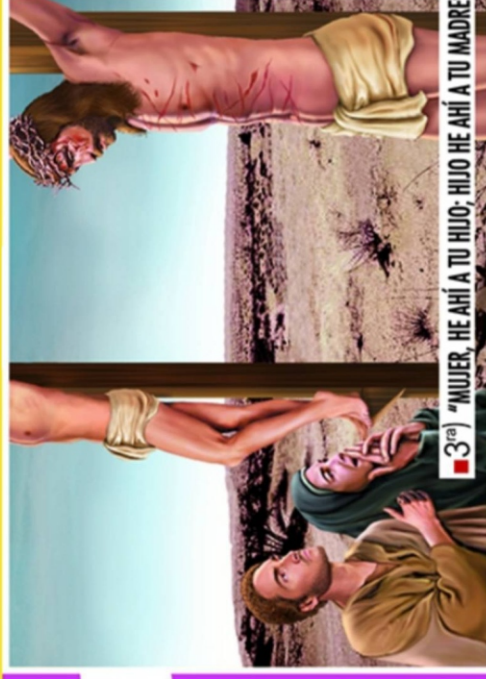
■ 3 ra ) "MUJER, HE AHÍ A TU HIJO; HIJO HE AHÍ A TU MADRE"