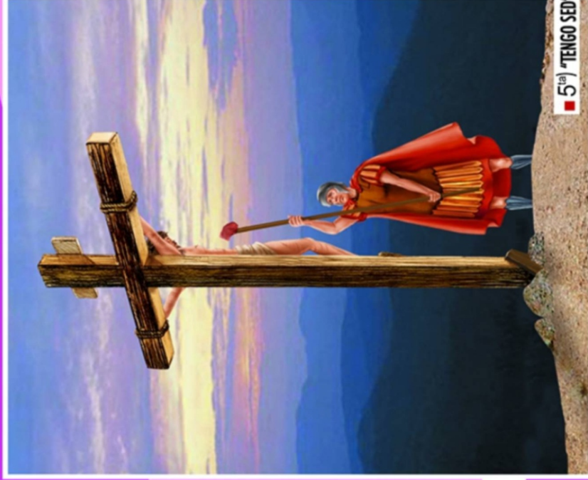
■ 5 ta ) "TENGO SED"