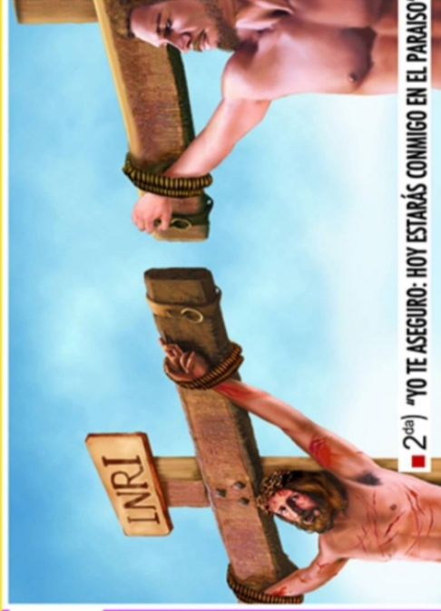
■ 2 da ) "YO TE ASEGURO: HOY ESTARÁS CONMIGO EN EL PARAISO"