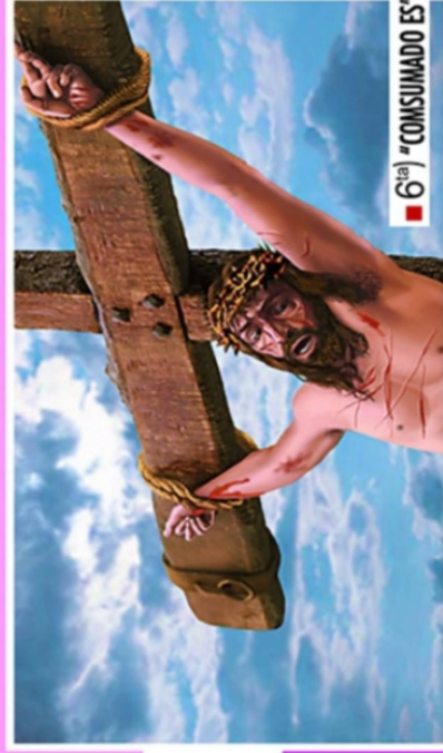
■ 6 ta ) "CONSUMADO ES"